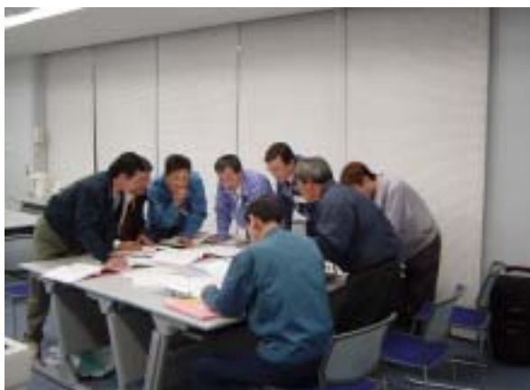
監査側チェックリスト作成