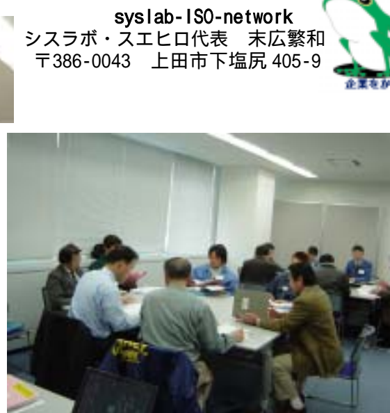
被監査側 受審の作戦会議