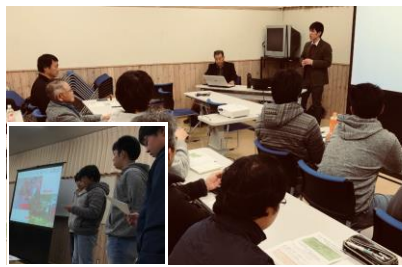
長野大学学生と里山再生コラボ