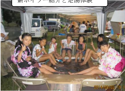
薪ボイラー紹介と足湯体験